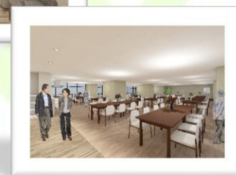
*2F ロビーと9F 食堂